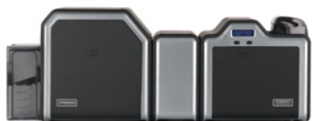
Imprimante/encodeur double face combinée au module de lamination