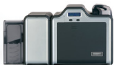
Imprimante/encodeur double face