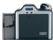
Imprimante/encodeur simple face

L'impression à haute définition permet de fournir la meilleure qualité possible en termes d'image sur des cartes fonctionnelles de niveau supérieur. Le film HDP fusionne avec la surface des cartes de proximité et à puce, en tenant compte des imperfections (arêtes et dentelures) formées par les composants électroniques intégrés.