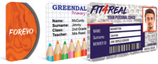
Cartothèque en ligne