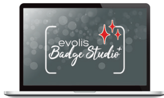
Logiciel de personnalisation de cartes Evolis Badge Studio®