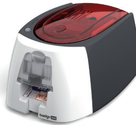
Imprimante à cartes Badgy