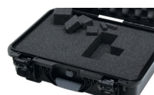
Calages de mousse cubique