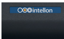
Étiquette autocollante personnalisée