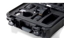
Mousse coupée sur mesure