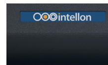
Étiquette autocollante personnalisée