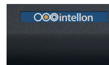
Étiquette autocollante personnalisée