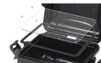
Ensemble de panneau étanche