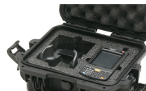
Mousse coupée sur mesure